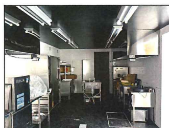
管理棟・業務用キッチン