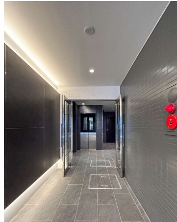
▲1Fエントランスホール

物件種目／貸事務所、貸店舗 所在地／福岡市中央区大名2丁目1-37 交通／西鉄大牟田線 福岡(天神)駅 徒歩6分 構造／鉄骨鉄筋コンクリート造 地上7階建 竣工／平成1年7月 設備／EV、光ファイバーケーブル 契約期間／普通借家契約2年(自動更新) 駐車場／無 その他／・集合袖看板有(別途費用必要) ・インフォメーション看板取付義務あり(テナント負担) ・水町費(業種により実費負担の場合有り)