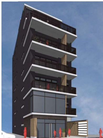
▲外観イメージ ▼2024年6月時点