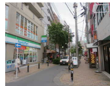
オレンジ通り商店街