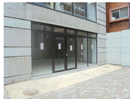
▲1F 貸室外観(現テナント入居時撮影)