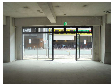
▲1F 貸室内(現テナント入居時撮影)